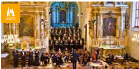
Katholische Kirche St. Martin Gengenbach