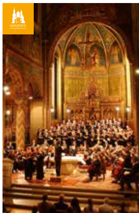
Katholische Stadtkirche St. Marien, Gengenbach