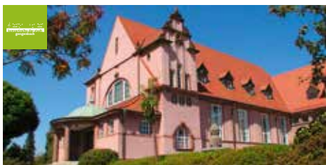
Stadthalle am Nollen in Gengenbach

ViSdP: Evangelische Kirchen- und Katholische Pfarrgemeinde, Kultur- und Tourismus GmbH, Gengenbach