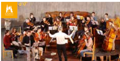
Evangelische Kirche Gengenbach